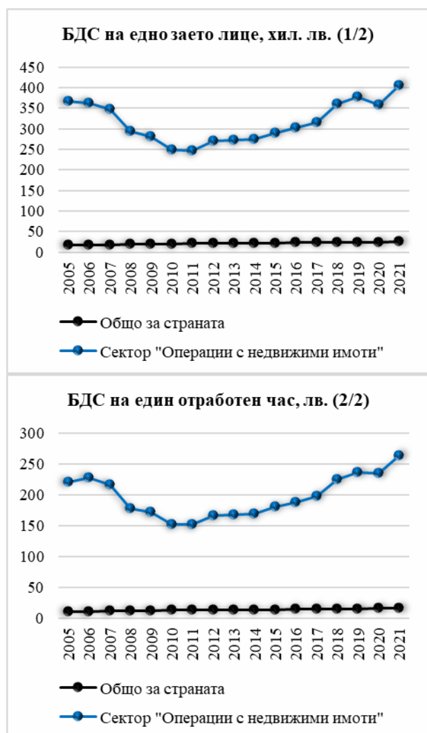
Фиг. 6. БДС на едно заето лице (в хил. лв.) и един отработен час (в лв.) на заето лице в сектор „Операции с недвижими имоти“ и общо за страната за периода 2005-2021 г.

Данни за годишната производителност, измерена с БДС на едно заето лице, и БДС на един отработен час, са представени на фиг. 6.