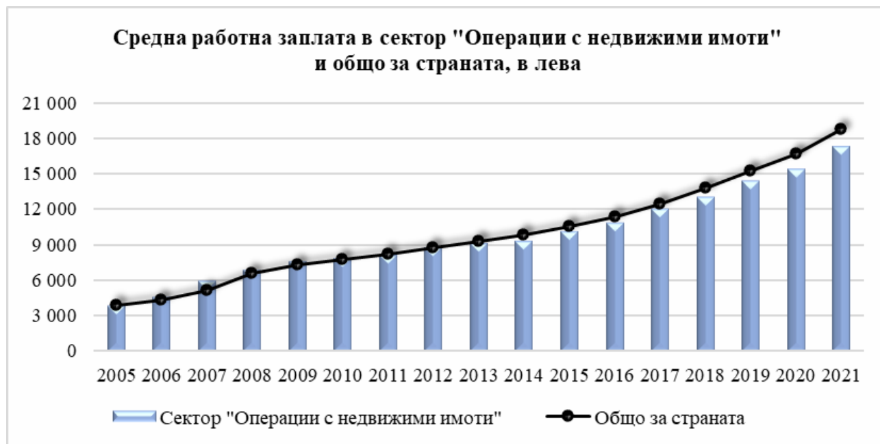
Фиг. 2. Средна работна заплата в сектор „Операции с недвижими имоти“ и общо за страната за периода 2005-2021 г., в лева

раждения в сектор „Операции с недвижими имоти“ до 2012 г. (с изключение на 2011 г.) са малко над средните – между 1 и 16 %, от 2013 г. са близки, но под средните нива (между 92 и 98 % от тях) (вж. фиг. 2).