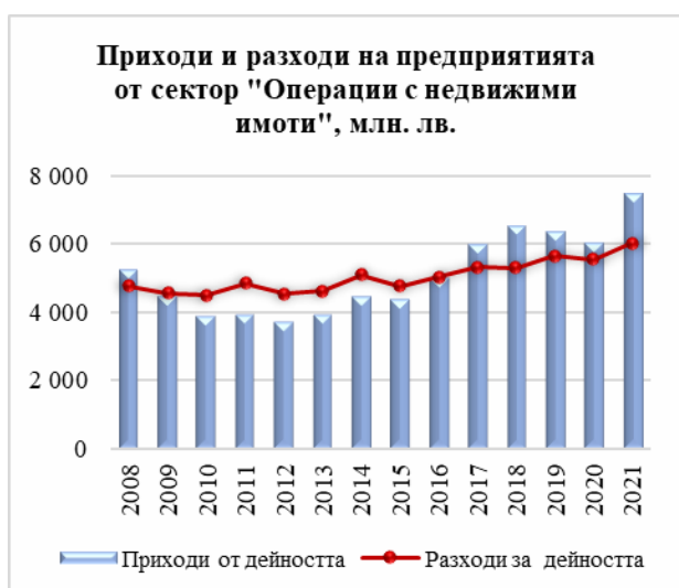
Фиг. 4. Приходи от дейността и разходи за дейността на предприятията от сектор „Операции с недвижими имоти“ за периода 2008-2021 г.

Друг интересен факт, който се очертава на база на представените данни и проведени допълнителни проучвания е, че резултатът от производствена дейност в сектора на недвижимите имоти, измерен с БДС, надвишава 2, дори 3 (2021 г.) пъти този в сектор „Строителство“ . Изключение се наблюдава в периода 2007-2011 г., когато варира между 1,5 и 1,9. Това обаче в никакъв случай не кореспондира с ефективността от дейността на функциониращите в сектора стопански субекти (поне по отчетни данни). За периода 2009-2016 г. предприятията в сектора на недвижимите имоти са направили повече разходи за дейността от реализираните приходи от дейността за съответната година (вж. фиг. 4), като отрицателната разлика се дължи главно на спад в приходите на стопанските субекти през кризисната 2009 и следващата - 2010 г., който спад е компенсиран едва през 2017 г.