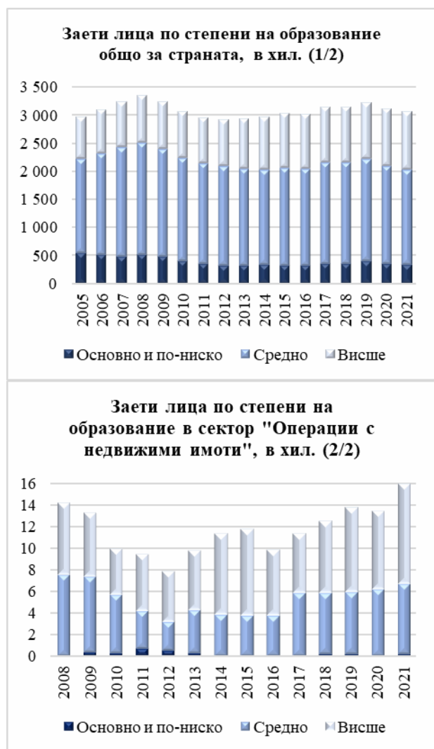
Фиг. 3. Заети лица по степени на образование в сектор „Операции с недвижими имоти“ и общо за страната за периода 2005-2021, в хил.

Източник: Разработена от автора по данни от НСИ.